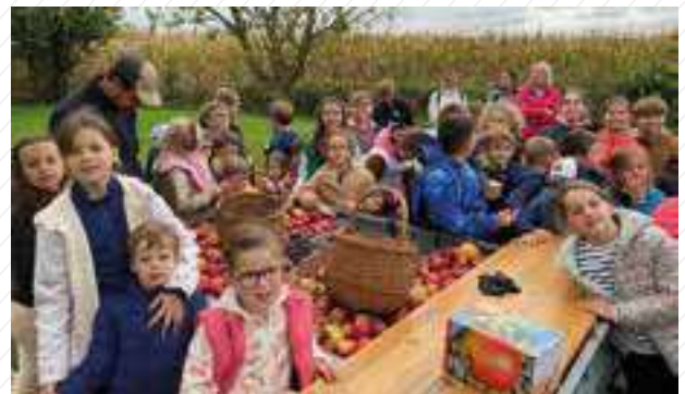
Octobre : Ramassage des pommes / jus de pommes