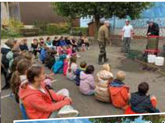
L'animation jus de pommes