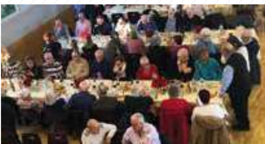
14 décembre : Fête de Noël des Aînés