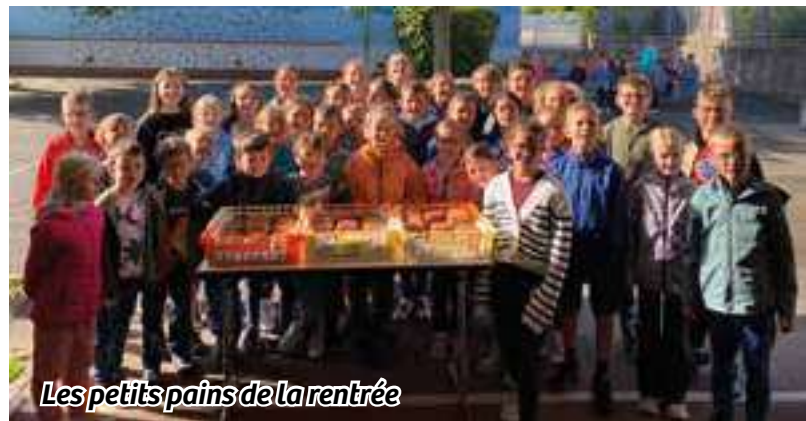
Les petits pains de la rentrée