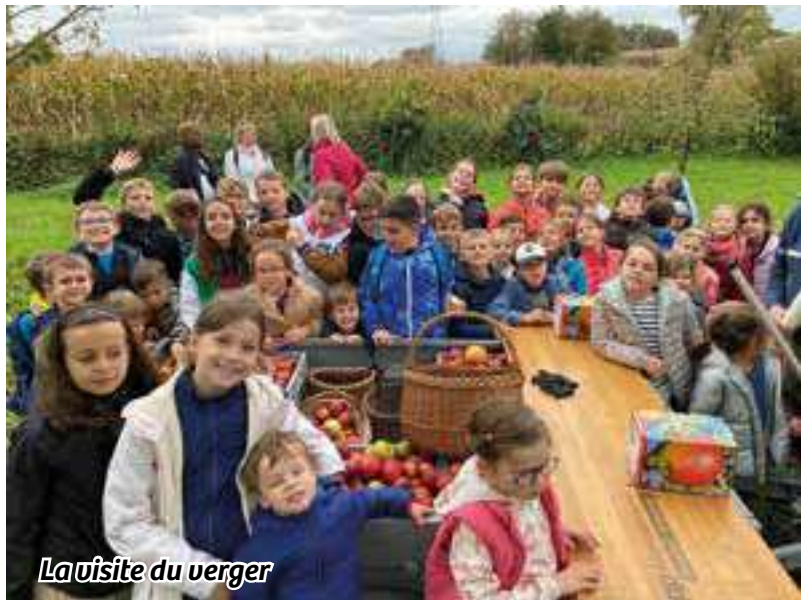
La visite du verger