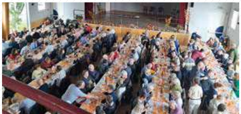
29 septembre : Choucroute de la Paroisse