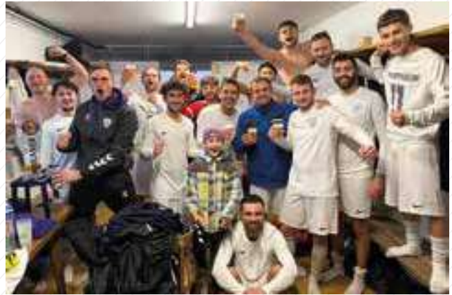
L'équipe 1 a su sortir victorieuse face au FC Brunstatt

Durant la trêve, ils s'entraînent dans une salle à Sierentz le samedi après-midi.