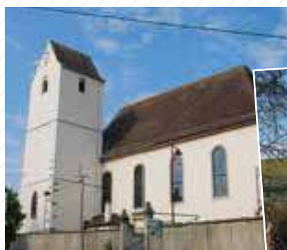
Regards sur Uffheim