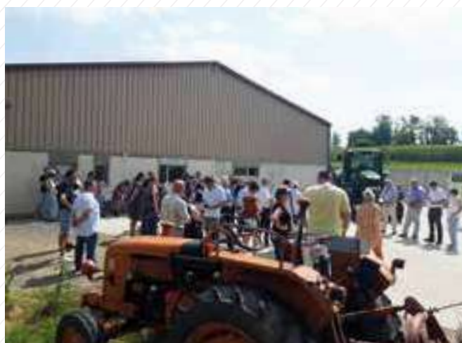
15 juin : Fermes ouvertes