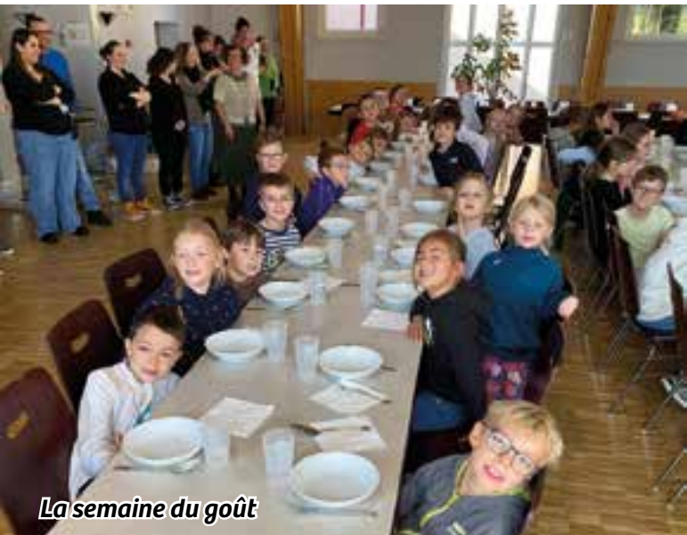
La semaine du goût