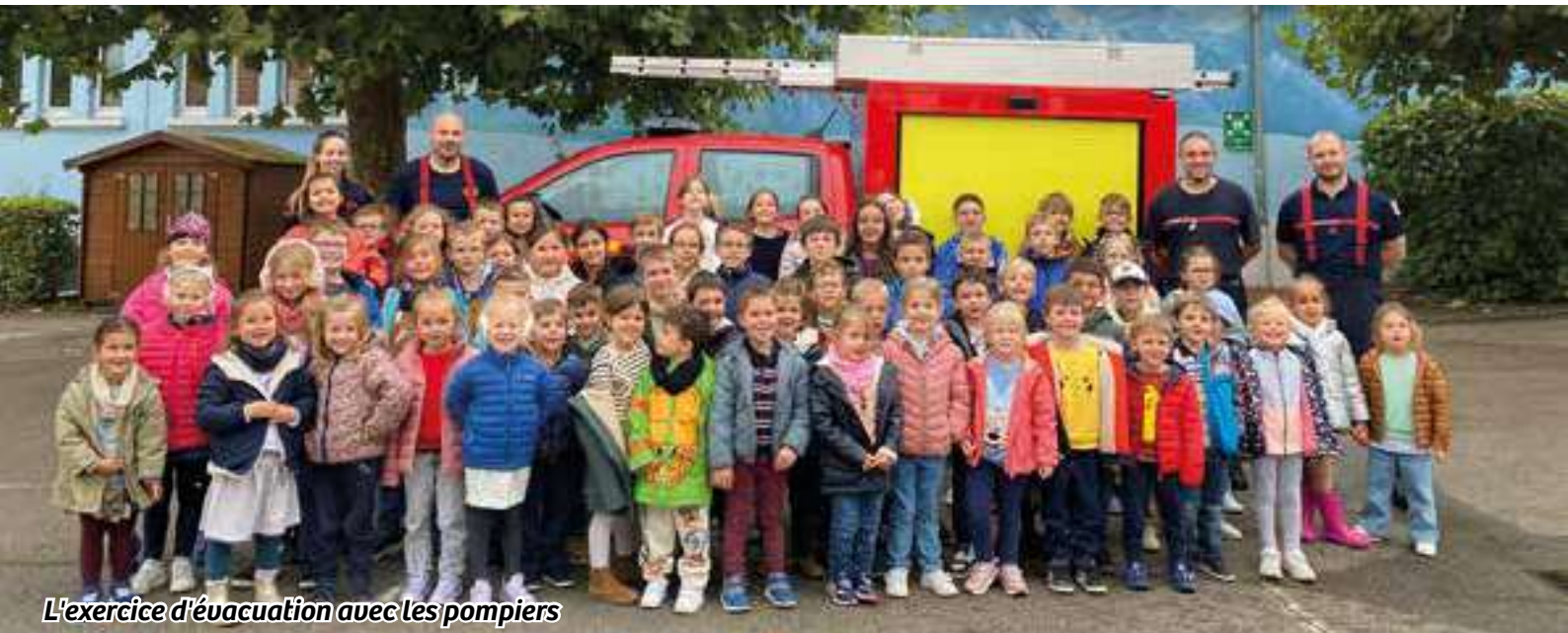
L'exercice d'évacuation avec les pompiers