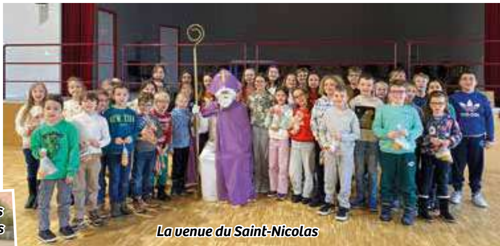
La venue du Saint-Nicolas