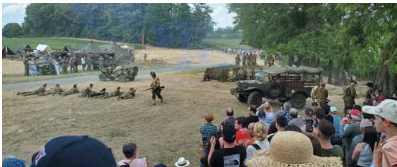
11 au 14 juillet : Reconstitution militaire à la Casemate