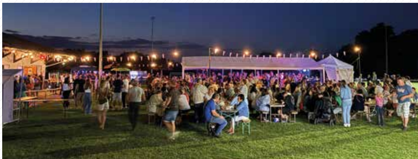
11 juillet : Fête tricolore