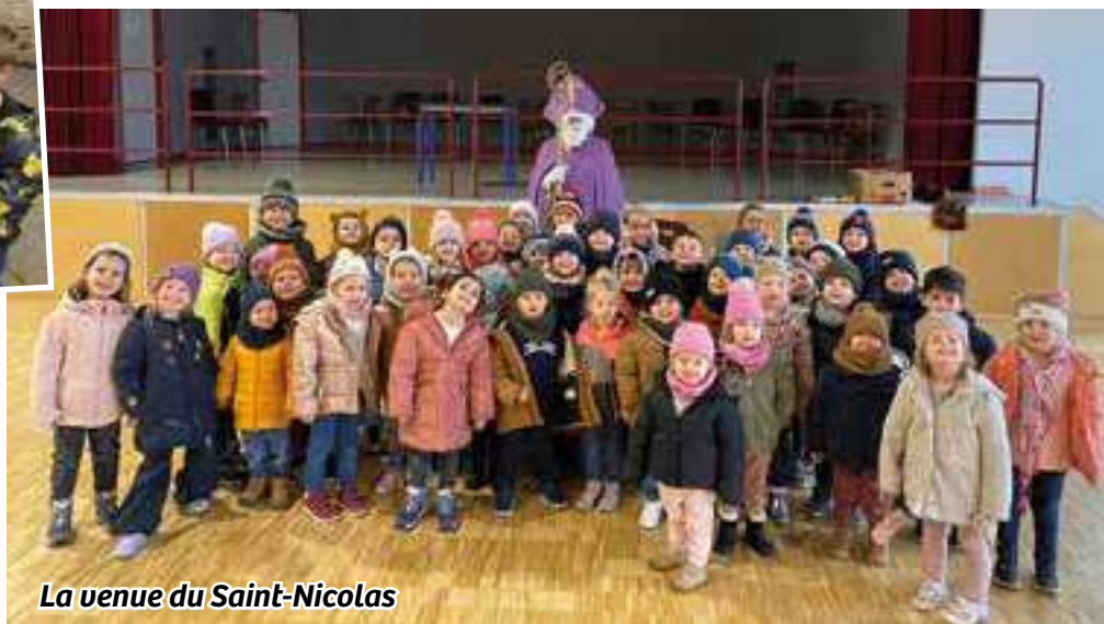
La venue du Saint-Nicolas