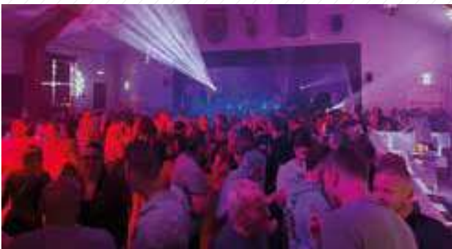
18 octobre : Le Best of du Best of