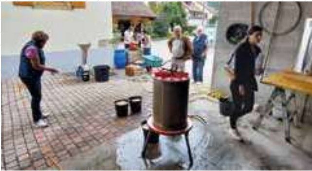
21 septembre : Journée du Patrimoine