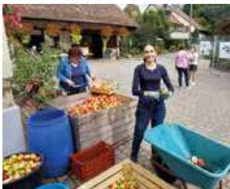
21 septembre : Journée du Patrimoine